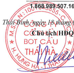
Ngô Tiến Cường